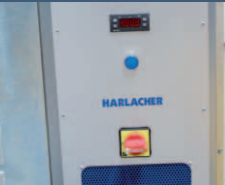
Steuerung mit Funktionstastenterminal Control unit with function key terminal